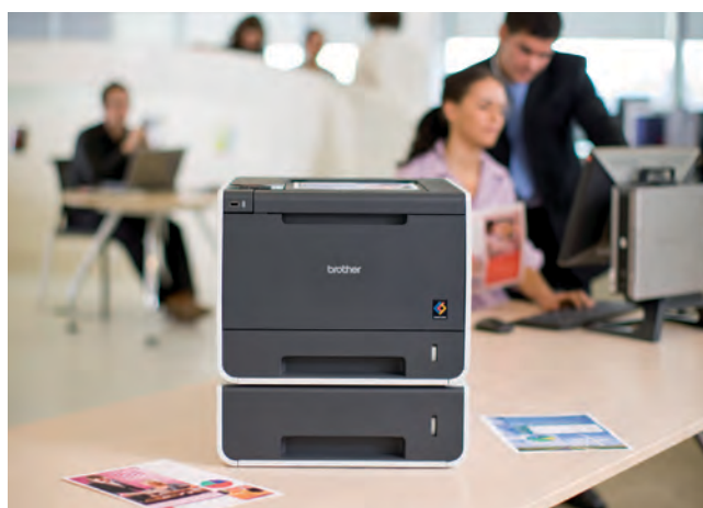
Erinomainen verkkotulostin suurella paperikapasiteetilla kiireiseen toimistoon.