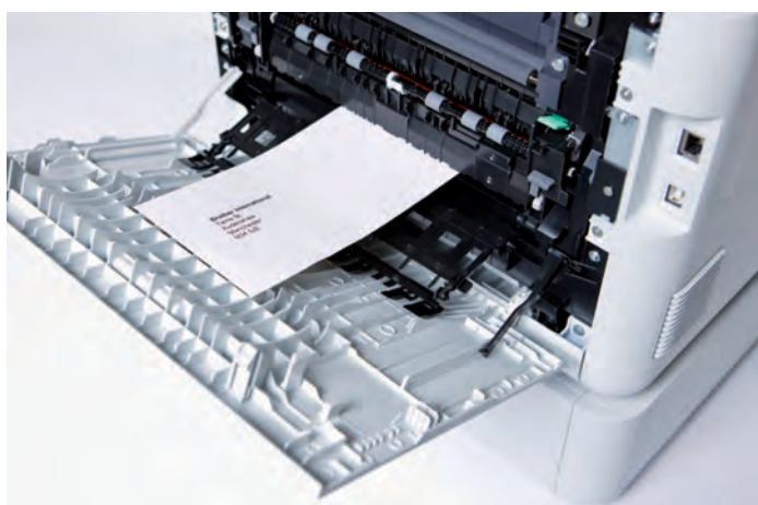
Suora paperirata helpottaa tulostusta kirjekuorille.

SSL-salaus. Vaikka tulostustyö siirtyy verkossa muutamassa sekunnissa, on sekin riittävän pitkä aika verkkoliikenteen hakkerointiin.. Tulostusdatan suojaus SSL-salauksella estää dataa joutumasta väärin käsiin.